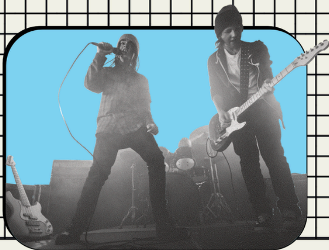
Spring op het podium met de Band Boost