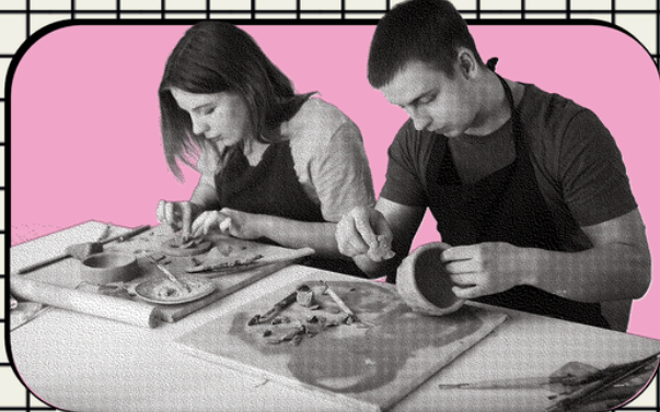
Sluit je aan bij SPOT

Met de bijzondere projecten wordt er extra aandacht besteed aan mensen die minder makkelijk met cultuur in aanraking komen, omdat Toonbeeld gelooft dat cultuur bijdraagt aan zelfvertrouwen, verbinding en plezier.